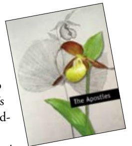
Lady's slipper ( Cypripedium calceolus )

Drawing of the Japanese lady's slipper ( Cypripedium japonicum ), the Thunberg Room, Museum of Evolution, Uppsala University.