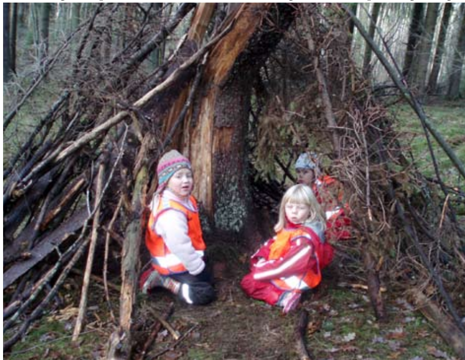
Upplevelser i naturen ger stoff till filmade berättelser.

De tycker att det mest intressanta har varit att se hur filmerna verkligen blivit barnens egna. Barnen har varit delaktiga i varje moment, och det är deras eget material som använts, men det gäller att ta tid på sig, låta barnen reflektera och tänka. Det är också viktigt att de vuxna ibland håller inne med sin egen kunskap för att låta barnen pröva egna vägar.