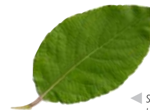
◀ Sälgen har läderartade, ludna blad.

På stora sälppipor går det också att göra fingertoppshål som på en spilåpipa eller blockflöjt för att få olika toner. Spilåpipa , spelpipa , spålapipa , låtapipa är dialektala namn för en sorts flöjt med åtta hål i. Den här typen av instrument har rötter inom fäbodkulturen men har funnits i stora delar av landet.