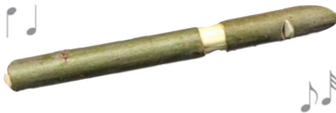
◀ Den här sälgen savar inte riktigt än.

Arbeta mot ett träunderlag. Kapa pinnen snett som ett munstycke (1). Gör ett V-format snitt in i veden (2) och ett ringskär enbart genom barken (3). Lossa barkbiten ovanför ringskåret (4) från veden genom att knacka kraftigt på barken runt om, gärna med ett runt föremål, exempelvis knivskaftet. Skär av en grund luftkanal från spetsen nedåt mot V-snittet i den yttre delen av veden (5). Skär därefter av pinnen vid V-snittet (6). Fukta ytterdelen i munnen och sätt försiktigt tillbaka den i det lösa, sköra barkröret (7). Blöt den barkade delen av pinnen och stick försiktigt in den i röret (8). Prova pipan. Genom att föra den nedre delen ut och in kan tonen höjas och sänkas.