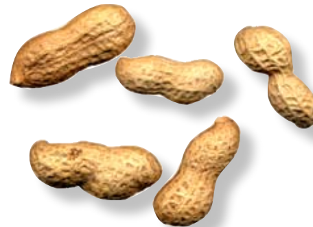
C. Jordnötten har ett torrt yttre skal som innehåller två eller tre frön. Det spröda fruktskalet multnar lätt sönder.