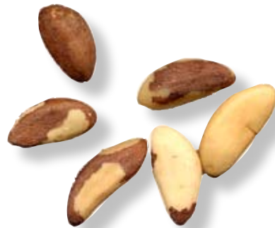
B. Paranötter är frön som har utvecklats i en klotrund fruktbildning helt utan köttigt innehåll. En frukt kan innehålla upp till tjugofyra paranötter och väga flera kilo.