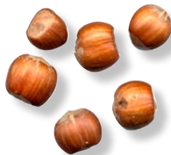
E. Hasselnötten har ytterst en riktigt hård och torr fruktvägg och innanför den finns fröet som är det vi äter.