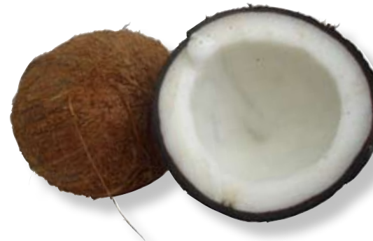
F. Kokosnötten är grön när den plockas. Under det läderartade skalet finns ett tjockt fibröst lager. Innerst finns fröet avgränsat av en mycket hård fruktvägg.