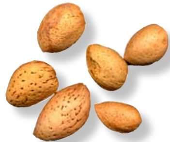
A. Krakmandelns (filippinötten) frukt har ett tunt skinn och innanför detta ett tunt köttigt skikt. Även det innersta skiktet som innehåller ett frö, är tunnskaligt och lätt att knäcka till och med med fingarna.

Sortera de olika "nötterna" med hjälp beskrivningarna och definitionerna här till vänster. Ta även hjälp av bilderna.