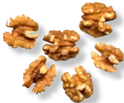
D. Valnötter har när de plockas från trädet ett köttigt överdrag. Vi äter fröet som omges av den hårda fröväggen.