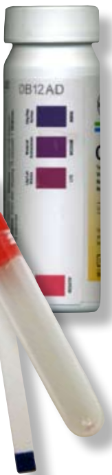
Mängden glukos testas med en Clinistix teststicka.