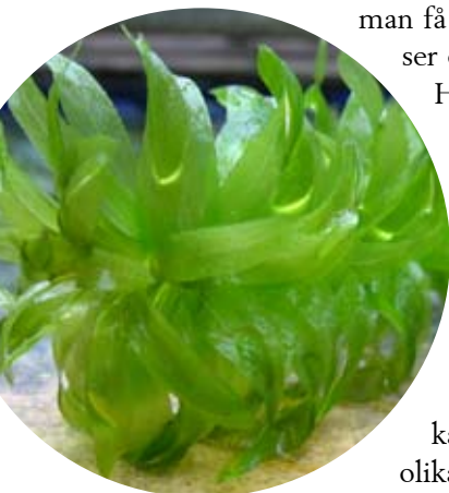
Vattenpest, Egeria densa , är bra att ha i akvariet från starten eftersom den motverkar alg tillväxt.

Många arter etablerar ett revir som de tappert