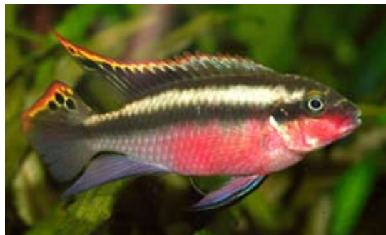
Palettciklid, Pelvicachromis pulcher , är den vanligaste av de mindre cikliderna och en av de lättaste arterna att få att leka.

Höjdpunkten när man håller på med akvarier är givetvis om man lyckas få fiskarna att föröka sig. Välj fiskarter som har olika fortplantningsstrategier. Det finns romspridare som aldrig bryr sig om ägg och yngel efter leken (1, 4, 9), skumbobyggare (2, 8), levandefödare (3), grottlekande utan yngelvård (7) och grottlekare med yngelvård (8). Utrymmet här är för litet för att