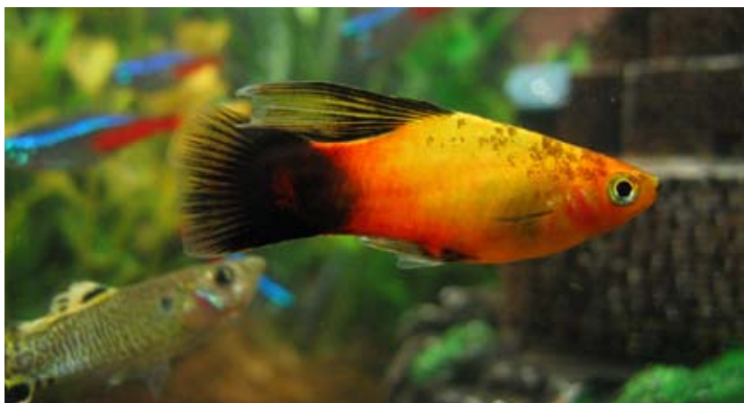
Platy, Xiphophorus maculatus , är en mycket vanlig akvariefisk. Det är i stort sett omöjligt att få tag på helt renrasig platy i zoohandeln, istället säljs fertila korsningar mellan platy och svärdbärare. Platin hör till de levandefödande tandkarparna ( Poeciliidae ). I själva verket kläcks äggen inne i honan omedelbart före "födseln". Det är alltså inte fråga om äkta födande utan så kallad ovovivipari.