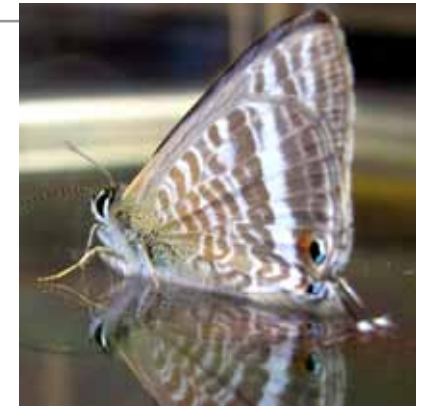
Långsvansad blåvinge, Lampides boeticus