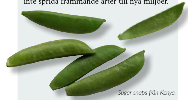
Sugar snaps från Kenya.

✎ Sugar snaps är tjockare än vanliga sockerärtor och brukar finnas under stora delar av året i grönsaksdiskarna. Ta bort plasten från en förpackning med sugar snaps och placera förpackningen i ett terrarium eller låda med myggnät. Efter en tid kan det hända att en vacker blåskimrande fjäril kläcks. Mata med sockervatten. Släpp inte ut fjärilen i naturen eftersom det är viktigt att inte sprida främmande arter till nya miljöer.