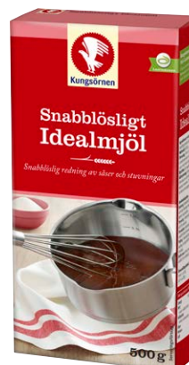
Vete som behandlats så att mjölpartiklarna blivit större och jämnare.