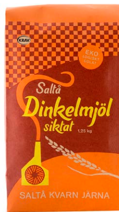
Dinkel eller spelt, en art inom vetesläktet