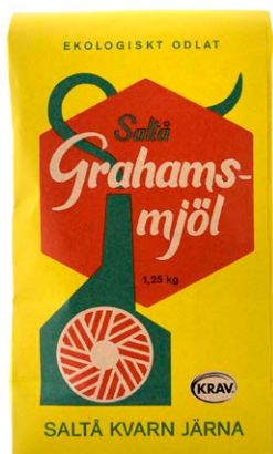
Vete. Gramhamsmjöl är ett fullkornsmjöl där vetekornets kärna och skalet har malts separat och sedan blandats.