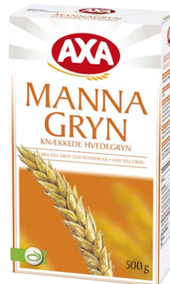
Vete. Mannagryn framställs av det inre av vetekornets kärna.