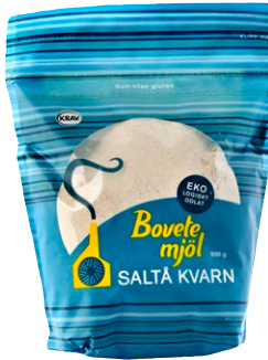
Bovete, en ört