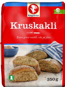
Vete. Kruskali är extra grovt vetekli, framställt av vetekornets skalskikt.