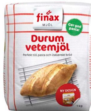
Durumvete, en art inom vetesläktet