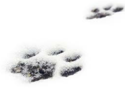
Kattspår i snön