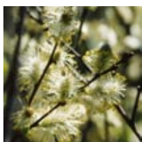
Bi t.v., blommande vide (Salix sp.)

Biet som syns på bilden har samlat pollen som det bär med sig på övre delen av det bakre benparet. Viktiga bi-växter på våren är olika videarter t.ex. sälg.