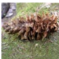
Hackspett t.v, grankotte t.h.

Hackspetten äter gärna grankottsfrön. Kotten får ett tufsigt utseende av skadade och kvarlämnade grankottsfjäll. (Ekorre och skogsmus biter av grankottsfjällen för att komma åt granfrön.)