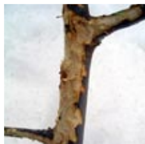
Hare t.v., kvist med gnag av hare t.h.

Haren livnar sig till stor del på knoppar och bark när marken är snötäckt. Markägare kan fälla buskar och träd av t.ex. sälg och asp för att haren lättare ska få tag i mat under vinterhalvåret.