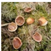
Ekorre t.v., hasselnötter t.h.

Ekorren äter gärna hasselnötter genom att klyva skalet på mitten. Ekorren samlar förråd av hasselnötter på hösten som den sedan vittjar under vintern.