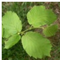
Vätteros t.v, hassel t.h.

Vätteros saknar helt klorofyll och lever därför som parasit på olika lövträd t.ex. hassel. Den växer på mullrika marker upp till Dalarna och Gästrikland och blommar i april-maj. Namnet har den fått av att den liksom vättarna lever större delen av sitt liv under jord.