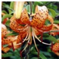
Liljebagge t.v. och tigerlilja t.h.

Liljebaggen är ibland en besvärlig skadeinsekt på odlade liljeväxter i trädgården. Den förekommer från Skåne upp till Västmanland.