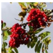
Sidensvans t.v, rönnbär t.h.

Sidensvansen flyttar söderut under hösten och livnar sig då t.ex. på rönnbär. Rönnbär som jäst och innehåller alkohol kan göra att fåglarna blir påverkade.