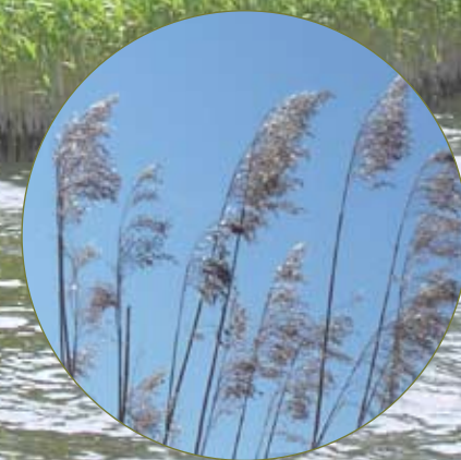
Vassen blommar i augusti - september. Vippan som är stor och yvig är först brunlila för att senare övergå i glänsande silverfärg.

Efter en tid tränger de späda ljusgröna skotten upp genom jordlagret. Prova gärna med fröställningar från andra gräsarter, till exempel havre eller vete.