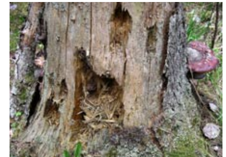
Överst en kotte som hackspetten hackat på, i mitten spår av granbarkborre som hackspetten gärna äter och underst spår av hackspettens födosök.