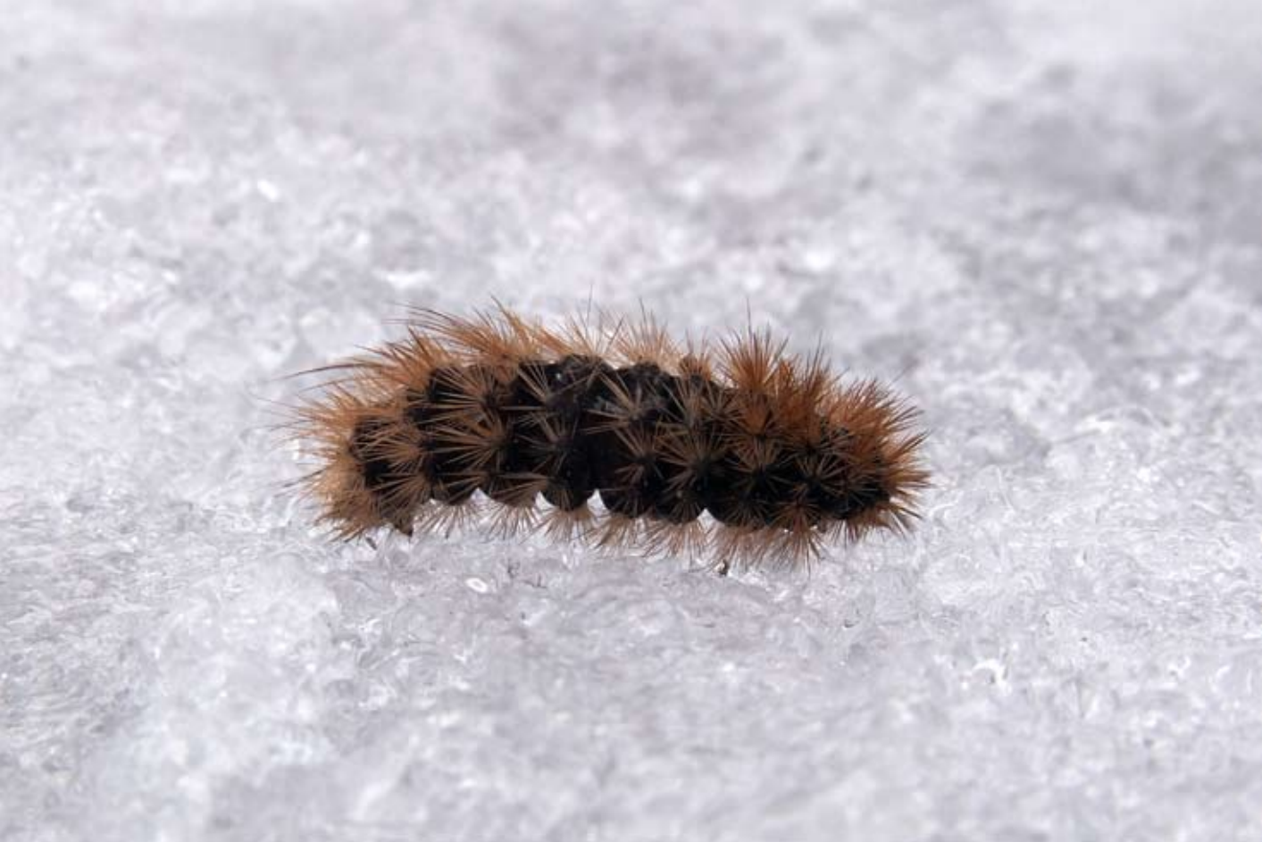
En rostvingelurv tar sig nyvaket fram över den kalla snön.