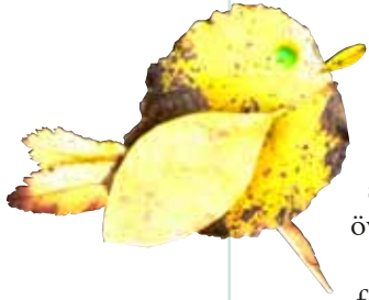
Liten fågel gjord av olika löv. Kanske föreställer den en gårdsmyg?