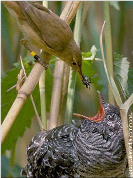
En gökunge som matas av en rörsångare.