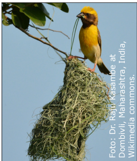
Bayavävare ( Ploceus philipinus ) tillhör familjen vävarfåglar, och är vanligt förekommande i stora delar av Asien.

Alla beteenden innehåller både någon form av ärftliga komponenter och inläring, därför är frågan om ett beteende är inlärt eller medfött inte helt relevant. Vissa beteenden är till större grad medfödda, instinkter, och andra verkar vara mer ett resultat av inläring.