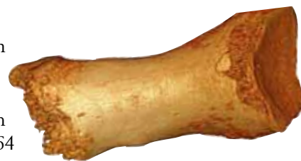
Fynd från en grotta i Sibirien av ett tåben från en neandertalkvinna. DNA från denna lilla benbit användes för att ta fram den hittills mest kompletta DNA-sekvensen från denna grupp av tidiga människor.

– Det första spåret var bara en liten bit av ett lillfinger, men man lyckades ändå få fram högkvalitativt DNA. Från början visste man inte att den lilla benbiten kom från en tidigare