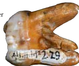
Tand från Denisovamänniska.