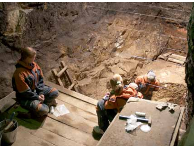
Överst syns ingången till den grotta där fynden av Denisovamänniskan gjordes. Nedre bilden visar utgrävningen. Grottan finns i den sibiriska regionen Altaj Kraj i Ryssland.

DNA från fossil benvävnad tas fram med en fin borr. Forskarteamet från Max Planck Institute for Evolutionary Anthropology i Leipzig, använde endast 400 mg pulveriserat ben till analysen av DNA.