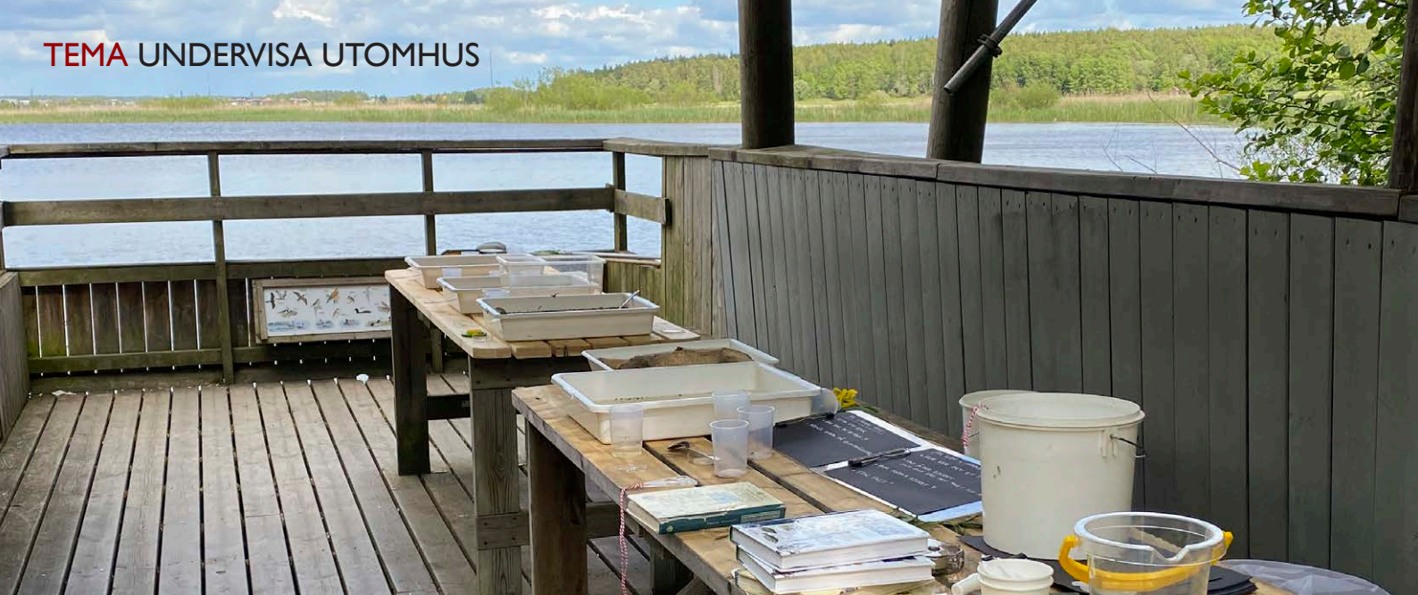
Fågeltomet i naturreservatet Årike Fyris, vid Övre föret i Uppsala.